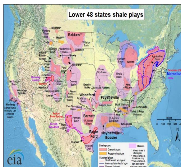
图 2 美国页岩油气区带分布

在地理位置上这几个盆地临近美国的西南地区，与美国的 Barnett、Eagle Ford 页岩油气区非常接近，因此其在地质成因及产状分布等方面很可能具有一定的相似