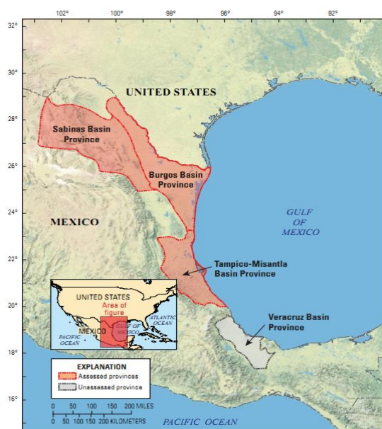
图 1 墨西哥东北部非常规油气评估区域

墨西哥目前为全球第 8 大原油生产国（原油产量占全球原油产量的 3.3%），同时也是全球原油重要出口国和美国的三大原油进口国之一。近日，美国地质调查局（USGS）联合美国国务院（U.S. Department of State）对墨西哥东北部 3 个盆地（Sabinas Basin、Burgos Basin、Tampico-Misantla Basin）的非常规油气资源（包括页岩气、页岩油、致密气、致密油和煤层气）进行了评估。从图 1、图 2 可以看出，